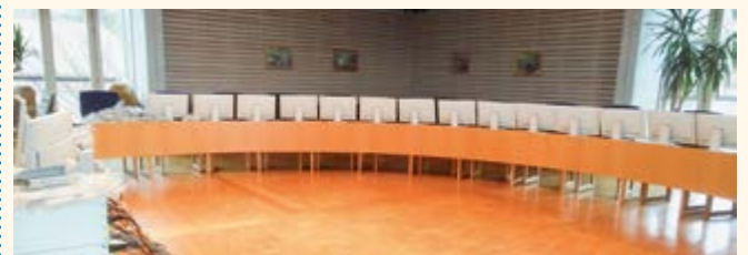
Bildschirm-Zwischendepot im großen Sitzungssaal

Die neue IT-Infrastruktur verbessert zudem die Anbindung der Außenstellen (Kindergarten, Kinderkrippe, Bauhof und Kläranlage) und erweitert die Arbeitsmöglichkeiten im Homeoffice. Wir bedanken uns für Ihr Verständnis während der Umstellungszeit.