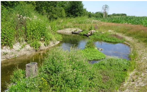
Abb. 1: Renaturierung des Kalterbachs von 2021 in diesem Sommer