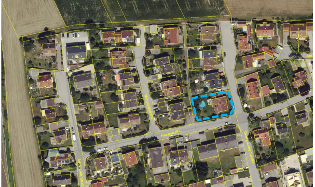
Abb. 3 Plangebiet (blau), ohne Maßstab, Quelle: BayernAtlas, © Bayerische Vermessungsverwaltung, Stand 01.2023

Das Plangebiet liegt im Nordwest des Ortsteils Hebertshausen. Es umfasst das Grundstück mit der Fl.-Nr. 535/11, Gemarkung Hebertshausen, und hat eine Größe von 841,8 m 2 . Der Bereich ist weitgehend eben und liegt auf ca. 487,5 m ü. NHN. (Normalhöhen-Null). Das Plangebiet liegt inmitten eines Allgemeinen Wohngebiets.