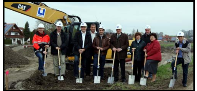
Spatenstich am 18.04.2012

Am 18.04.2012 fand im Baugebiet „Ampermoching Ost IV“ der erste Spatenstich statt.