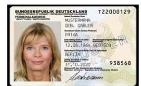
Personalausweis alt Personalausweis neu