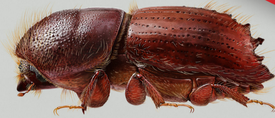
Größe Buchdrucker 5mm

Bekämpfen lässt sich der Buchdrucker nur durch vorbeugende Suche nach befallenen Fichten („Käferbäumen“) und rasches Fällen/Abtransport der befallenen Bäume (mind. 500m aus dem Wald).