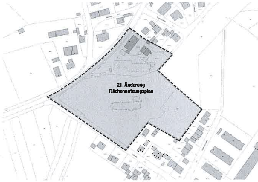
Lageplan zur 21. Änderung des Flächennutzungsplans der Gemeinde Hebertshausen

Der Gemeinderat hat am 12.12.2023 die 21. Änderung des Flächennutzungsplanes beschlossen. Der Geltungsbereich der Änderung umfasst die Flurnummern 839, 842, 842/39, 842/40, 842/41, 842/42, 842/43, süd-westliche Teilfläche aus 82, 836/3, 840/1, 828/4, 828/3, 828/2, 828/1, östliche Teilfläche aus 833 bis FINr. 832, südliche Teilfläche aus 943 beginnend im Westen mittig im Kreuzungsbereich Freisinger Straße/ Torstraße und endend im Osten mittig in der Freisinger Straße auf Höhe der FINr. 842/16 sowie eine Teilfläche 943/12 endend im Osten bei FINr. 842/16, alle Gemarkung Hebertshausen.